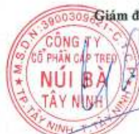
Trần Trung Kiên

Các Thuyết minh đính kèm là một bộ phận hợp thành của Báo cáo tài chính